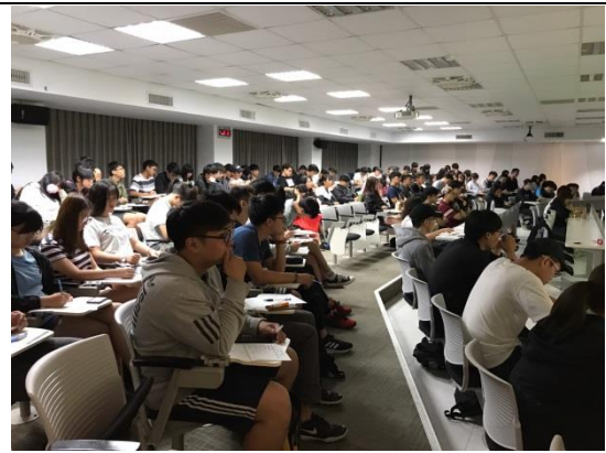
同學紀錄演講內容