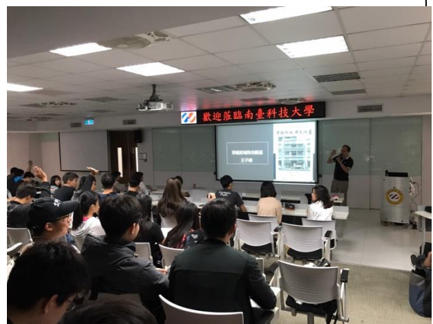
問與答時間-對於今日的演講內容提出不 懂或是想更了解的部分

註：舉凡工作坊、研討會、讀書會、專題演講等活動，皆請於活動後2週內填報本表。並繳交下列佐證資料：如活動海報、簽到表、活動照片（至少6張）、活動手冊、演講完整講稿或PPT等。繳交之檔案以原始檔為主(如 word、excel 等)。