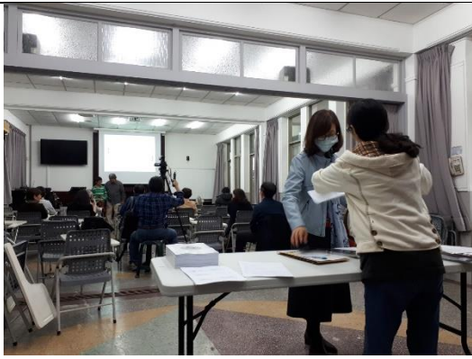
活動開始的前置作業布置