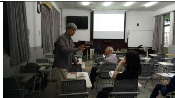
讀書會結束後講師與學員們討論讀書會的內容

註：舉凡工作坊、研討會、讀書會、專題演講等活動，皆請於活動後2週內填報本表。並繳交下列佐證資料：如活動海報、簽到表、活動照片（至少6張）、活動手冊、演講完整講稿或PPT等。繳交之檔案以原始檔為主(如word、excel等)。