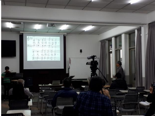
學生與講師一同唱歌