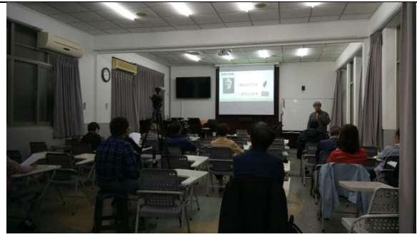
講師複習上個月上課內容