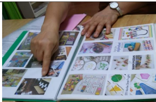
參考國外網站的資料