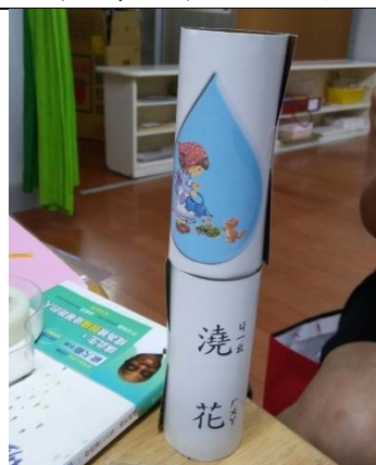
可以延伸製出教具 1 學字圖配對