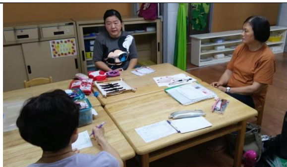
製做教具前的討論