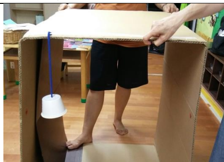
研究製做教具的過程