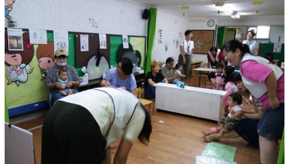
課堂老師、家長、孩子一片歡樂