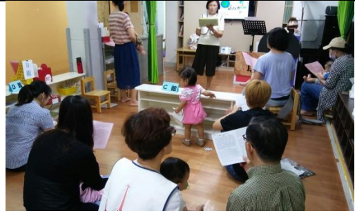
課堂一起讀親子兒少週報