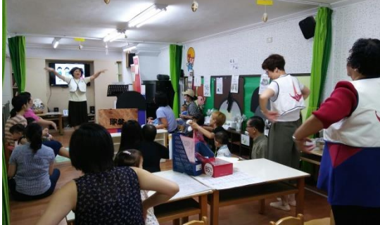
課堂大家一起做音階肢體動作