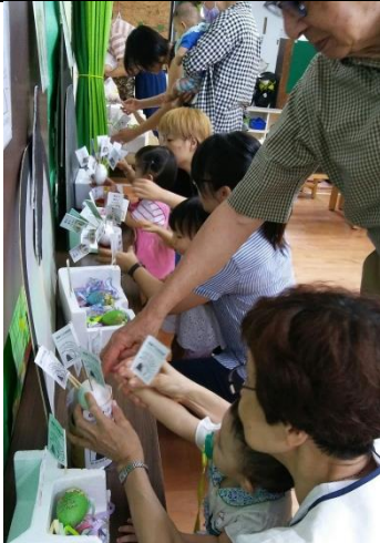
闖關遊戲:插得勝的旌旗(一)