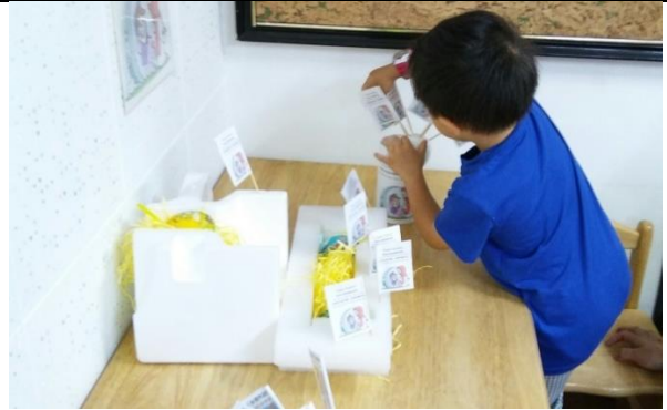
闖關遊戲:插得勝的旌旗(二)

註：舉凡工作坊、研討會、讀書會、專題演講等活動，皆請於活動後 2 週內填報本表。並繳交下列佐證資料：如活動海報、簽到表、活動照片（至少 6 張）、活動手冊、演講完整講稿或 PPT 等。繳交之檔案以原始檔為主(如 word、excel 等)。