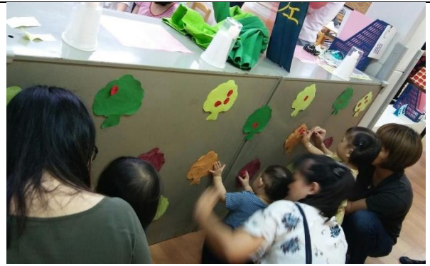
把蘋果貼在樹上，家長為孩子禱告3個品格

註：舉凡工作坊、研討會、讀書會、專題演講等活動，皆請於活動後2週內填報本表。並繳交下列佐證資料：如活動海報、簽到表、活動照片（至少6張）、活動手冊、演講完整講稿或PPT等。繳交之檔案以原始檔為主(如word、excel等)。