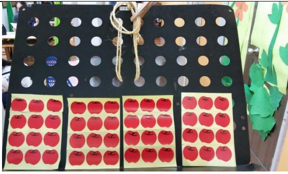
代表生命品格的蘋果貼紙