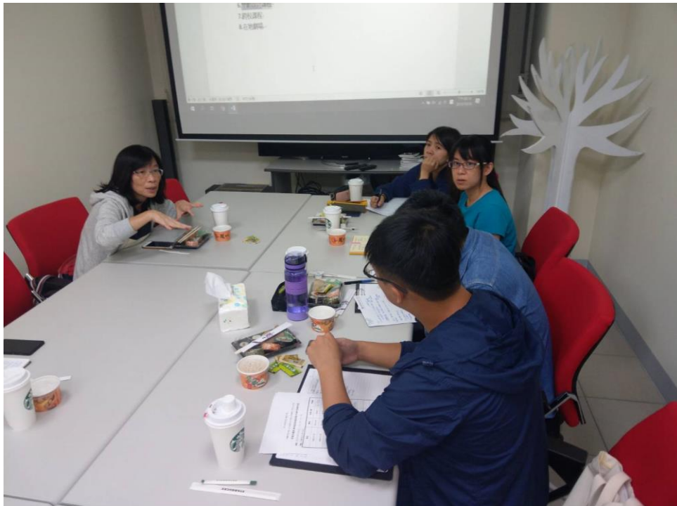
圖二：信義街區討論展板規劃