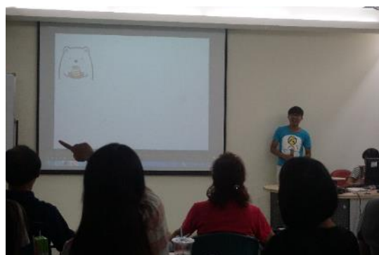
照片說明：美食組報告