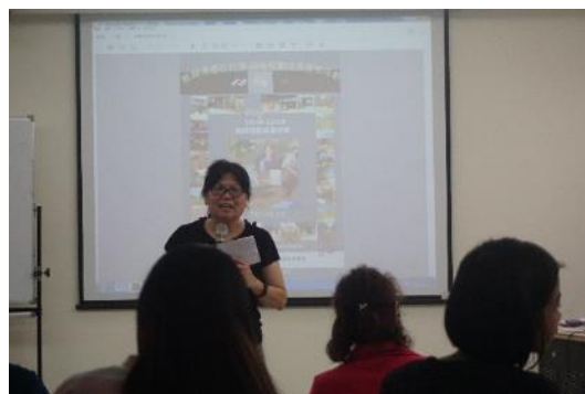
照片說明：介紹評審老師