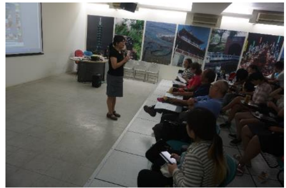
照片說明：主持人總結

註：舉凡工作坊、研討會、讀書會、專題演講等活動，皆請於活動後2週內填報本表。並繳交下列佐證資料：如活動海報、簽到表、活動照片（至少6張）、活動手冊、演講完整講稿或PPT等。繳交之檔案以原始檔為主(如 word、excel 等)。