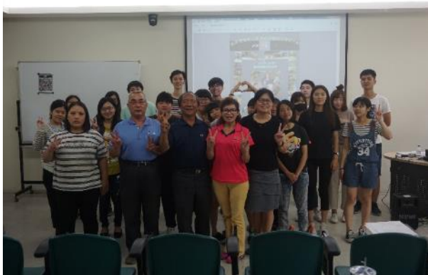
照片說明：全體合照