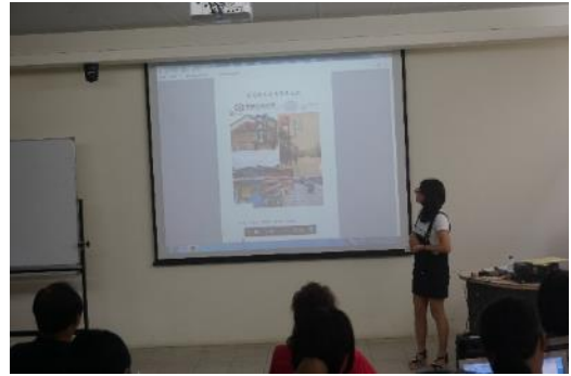
照片說明：老街組報告