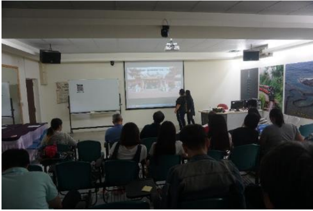
照片說明：廟宇組報告