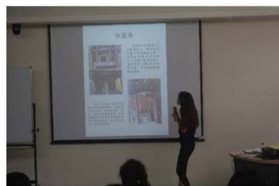
照片說明：蜂炮組報告