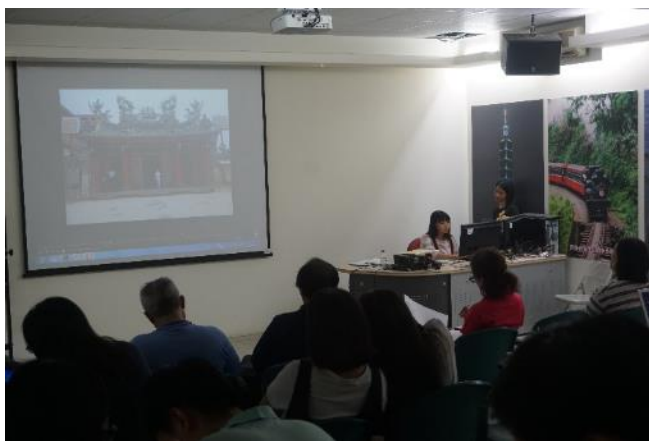
照片說明：燈會組報告